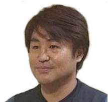
NPO法人生き生き元気塾 代表理事・塾長 健康運動指導士 精神保健福祉士